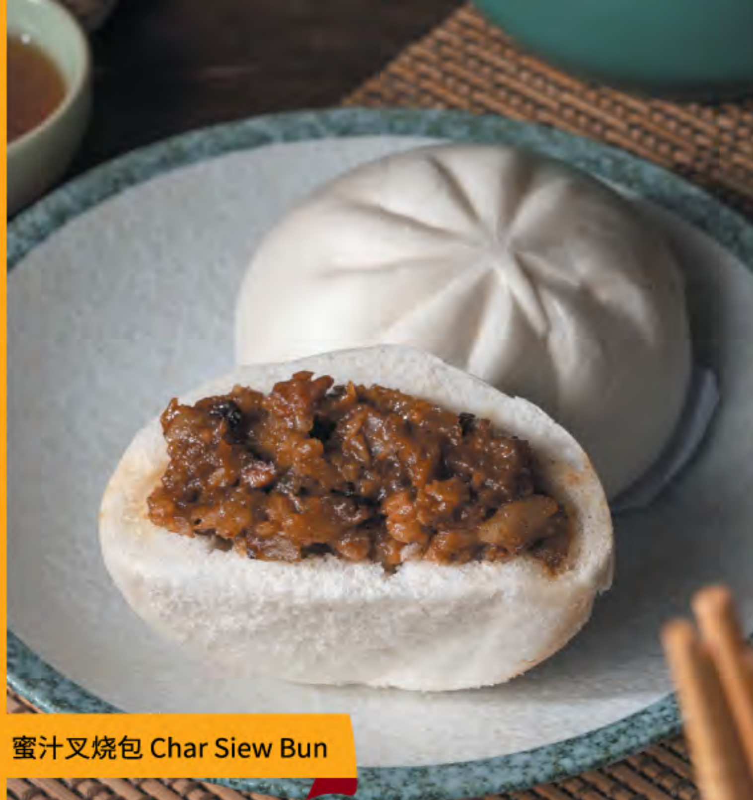
蜜汁叉烧包 Char Siew Bun