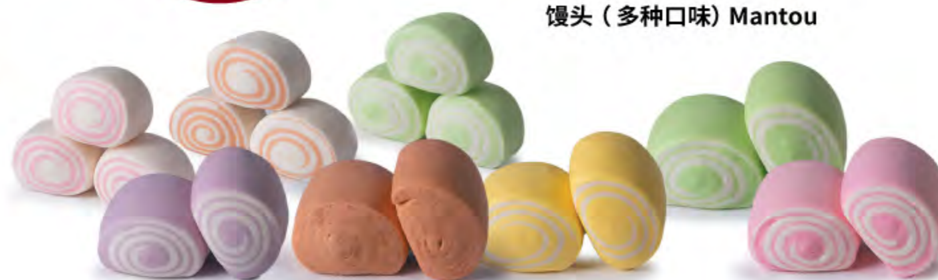
馒头 (多种口味) Mantou