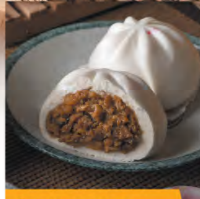
生肉包 Pork Bun