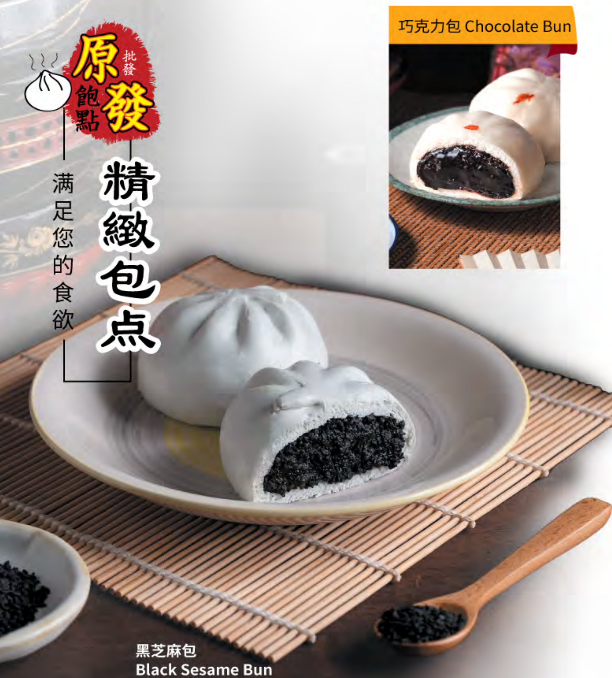
黑芝麻包 Black Sesame Bun