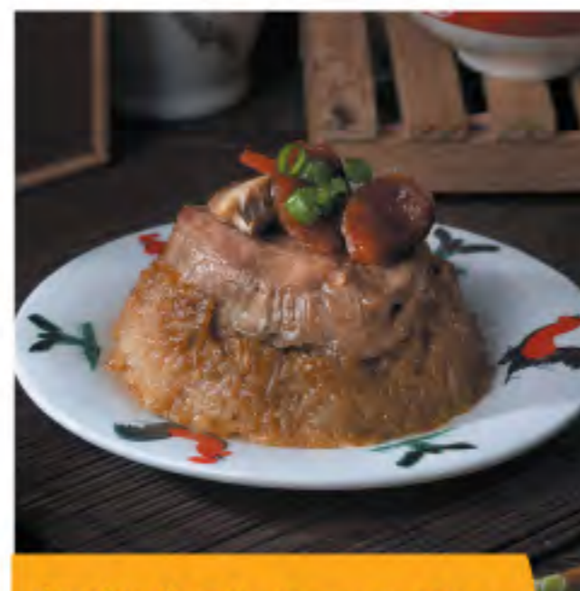
糯米鸡 Glutinous Rice