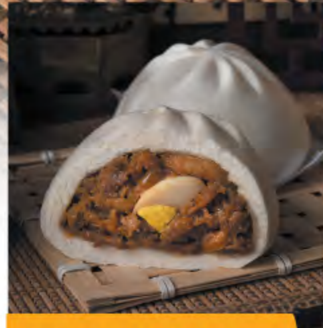
大包 Big Pork Bun